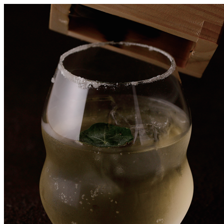
リンク8888ハイボール ¥1,000

べろり、と飲めちゃうから「べろ」と名付けられた日本酒のトニックウォーター割りだから「べろっと」。その名の通り、最近、流行りのアペロ(食前酒)でも屋からでも、新幹線までのちょっとした待ち時間でも、気軽にべろっと飲める一杯です。