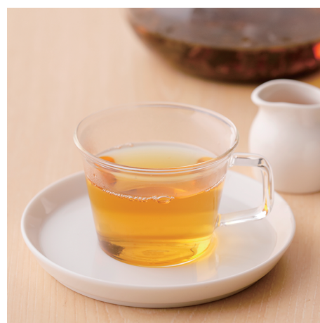
富山県産茶葉紅茶 ¥650 (ホット/アイス)

富山は国内のりんご産地の中でももっとも温暖なエリア。豊かな清流の恵み、そしてその気候により十分に熟成したりんごが収穫されます。そんな富山県産りんご100%ジュースに甘酒を合わせて、生姜のしっかりとした刺激を効かせました。