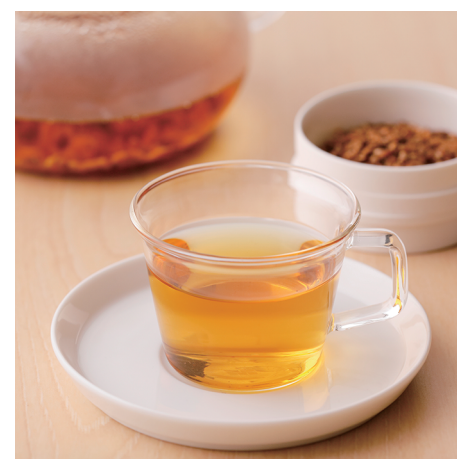
麴茶(ホット/アイス) ¥650

宇奈月温泉にある紅茶専門店がプロデュースした紅茶です。インドのヒマラヤ山脈ダーズリンから輸入した茶葉を黒部溪谷の湧水を用いて独自の製法で再仕上げをして作られています。なんととっても、マスカットを思わせる華やかな香りが特徴。化学香料などは使用せずに、茶葉の甘みと香りを最大限に引き出したそうですから驚きます。